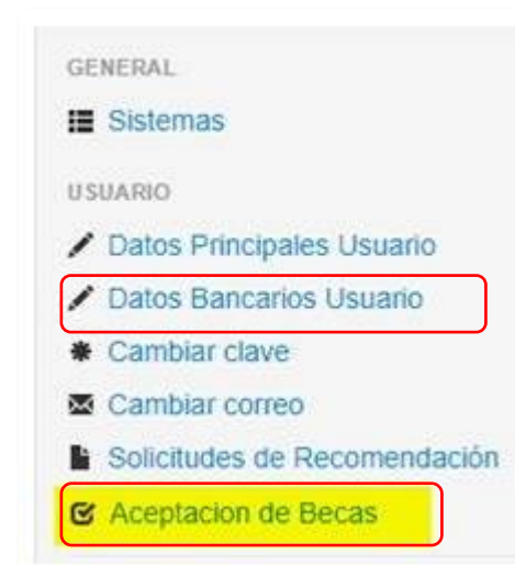
Formulario de Declaración de datos de contacto